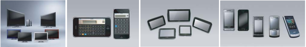
모니터 액정, 핸드폰 액정, 계산기 액정, 네비게이션 액정 등 필름, 유리필름 접합